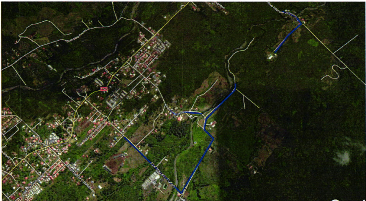
Plan de situation des réseaux à renforcer sur le secteur Dureau

Renforcement du secteur Dureau : Le développement démographique de ce secteur oblige la Collectivité à renforcer une partie du réseau de distribution, qui, par ailleurs, est rendu nécessaire compte tenu des nombreuses fuites constatées régulièrement sur le linéaire concerné par les travaux. Il s'agit d'augmenter le diamètre des canalisations existantes.